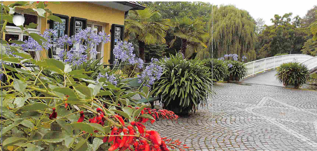
Der Eingang zur Insel Siebenbergen Entrance to Siebenbergen Isle

dis, snowdrops, crocuses, spring snowflakes, and winter aconite: they still turn the island into a sea of blossoms during springtime. Oaks were another of Wilhelm Hentze's collecting passions, and as a result, more than 50 different kinds may be encountered at Karlsaue or in the parks of Wilhelmshöhe (Kassel) and Wilhelmsthal (Calden), with seven species of oak growing on Siebenbergen alone. Until the 1940s, visitors were ferried to the isle of flowers by boat; the ferry, however, was destroyed during World War II. These days, a new bridge constructed for the Federal Horticultural Show of 1955 provides access to the isle.