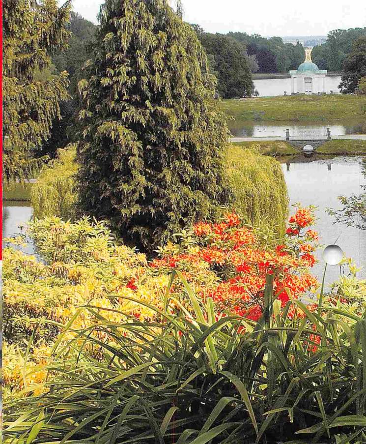
Blick von Siebenbergen über die Schwaneninsel bis zur Orangerie View from Siebenbergen over the isle Schwaneninsel towards the Orangery