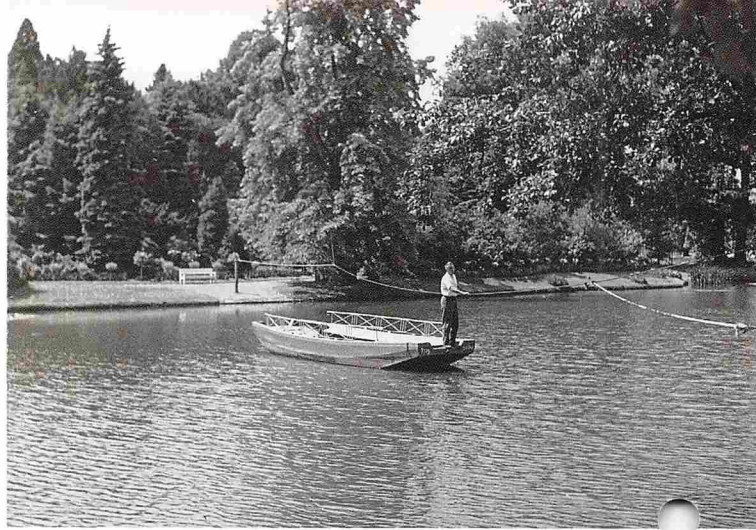
Bis zum 2. Weltkrieg erreichte man die Insel mit einer Fähre Before World War II, visitors were taken to the isle by ferryboat