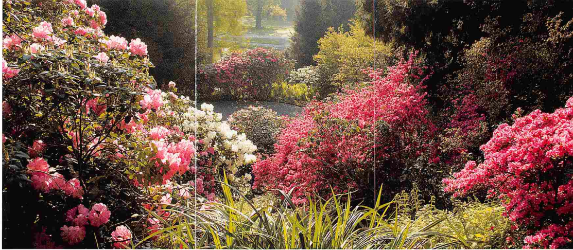
Blühender Rhododendron im Sonnenlicht Flowering rhododendron in the sunshine

Der Charme der Insel Siebenbergen liegt in den drei Höhenbereichen mit ihren ganz eigenen Bepflanzungen, die den natürlichen Standorten nachempfunden sind. Im unteren Teil führt der Weg vorbei an seltenen Bäumen, einer Moorbeetlandschaft, meterhohen Rhododendren und wildnisartig arrangierten Sommerblumenbeeten. Mit etwas Glück begegnet man hier einem der Pfauen, die auf der 2,5 ha großen Insel leben. Im mittleren Bereich gedeihen im »Alpinum« rund 100 verschiedene Pflanzenarten, die man sonst nur in den Gebirgen dieser Welt findet. Der Spaziergang führt schließlich auf das Plateau im oberen Bereich der Insel. Hier eröffnet sich als Höhepunkt ein malerischer Ausblick auf die Insel, ihre Pflanzenwelt und in die Karlsau. Kein Wunder, dass die Aussicht über die Schwaneninsel bis hin zur Orangerie zu den meistfotografierten Blickachsen des Parks gehört.