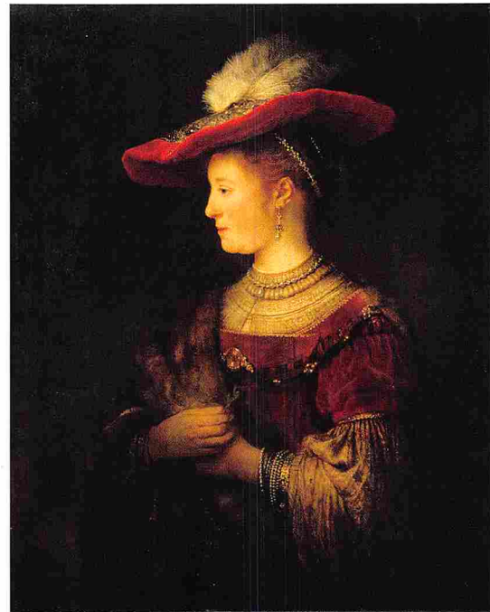
Rembrandt Saskia van Uylenburgh, 1642 MHK, Gemäldegalerie Alte Meister

The masterpieces of Dutch painting, presented on two floors, constitute the crowning glory of the art collection. The second floor houses Early Netherlandish paintings including works by Jacob Cornelisz van Oostanen, Frans Floris, Anthonis Mor, and Pieter Aertsen. One of several outstanding pieces is Maerten van Heemskerck's family portrait, one of the earliest secular group paintings in history. The sheer range of Dutch painting of the time – landscapes and seascapes, still-lives, interiors and genre scenes – becomes evident in the side rooms, where the works on display include landscapes by Ruysdael as well as Jan Steen's »Bean Feast«.