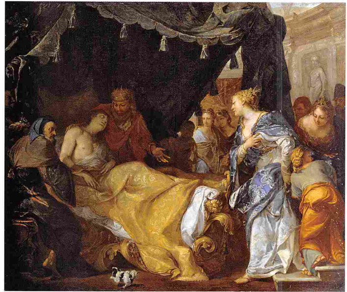
Antonio Bellucci Antiochus und Stratonike, um 1708–10 MHK, Gemäldegalerie Alte Meister

The Kassel art gallery, famous especially for its works of Dutch art, is among the most eminent institutions of its kind and looks back on more than 500 years of history. Three princes in particular assembled this collection, building on older landgraval art treasures. Landgrave Carl (1654 – 1730) was focused on Italy first and foremost. The connoisseurship of his son Wilhelm VIII (1682 – 1760) has bequeathed us numerous masterpieces of Dutch and Flemish art. Wilhelm's son, Friedrich II (1720 – 1785), continued the collecting tradition and in his later years founded the Museum Fridericianum, the first purpose-built museum on the European continent. Later generations continued to add to the art gallery, and today the museum's three floors showcase European art history from the late Gothic period to the early years of Neo-Classicism.