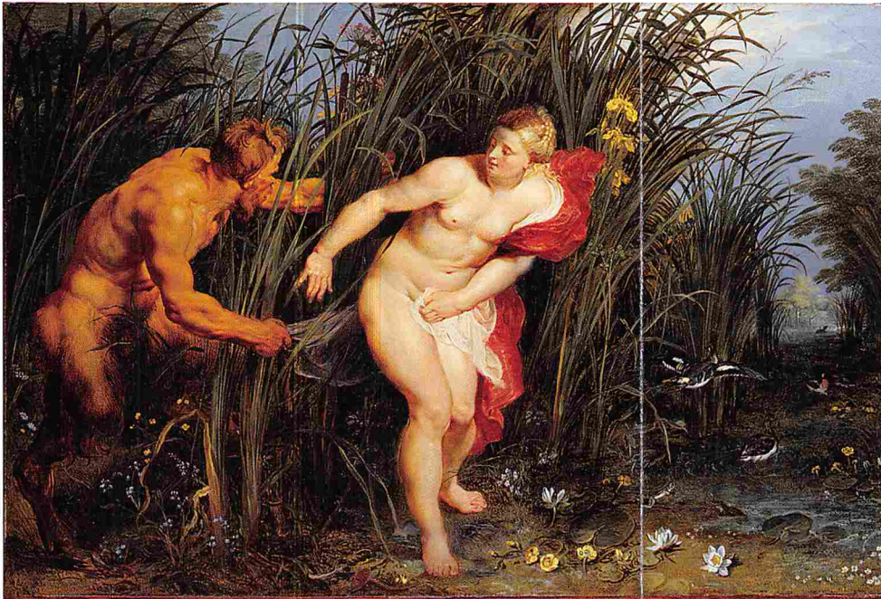
Peter Paul Rubens und Jan Brueghel d. Ä. Pan und Syrinx, 1617 MHK, Gemäldegalerie Alte Meister