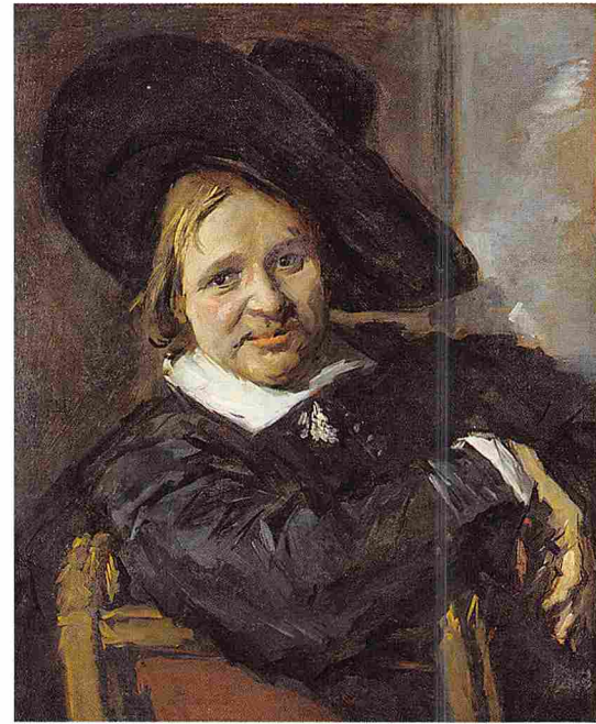
Frans Hals Der Mann mit dem Schlapphut um 1660, MHK, Gemäldegalerie Alte Meister

On the third floor, numerous masterpieces by Peter Paul Rubens, Anthony van Dyck and Jacob Jordaens are on display. The side rooms hold works by their Flemish fellow artists David Teniers the Younger and Frans Snyders, as well as other masters. The collection of works by Frans Hals is the largest outside the Netherlands. His »Portrait of a Man with a slouch Hat«, painted in loose spontaneous brushstrokes, has delighted colleagues Max Liebermann and Lovis Corinth. The collection of works by Rembrandt and his circle includes twelve outstanding paintings in the master's own hand, principal among them a rare history painting from his later years, »Jacob Blessing the Sons of Joseph«, and the »Half-Length Portrait of Saskia van Uylenburgh«, one of the loveliest portraits of the artist's wife.