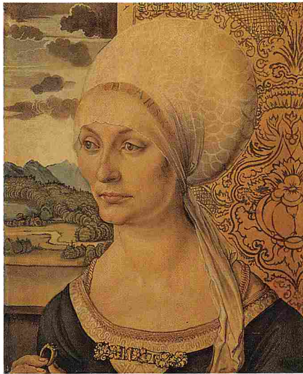
Albrecht Dürer Bildnis der Elisabeth Tucher, 1499 MHK, Gemäldegalerie Alte Meister

Das 1. Obergeschoss zeigt deutsche, italienische, französische und spanische Malerei. Neben Albrecht Dürers berühmtem »Bildnis der Elisabeth Tucher« sind mit Albrecht Altdorfer, Lucas Cranach und Hans Baldung Grien weitere Zeitgenossen prominent vertreten. Ein monumentales barockes Tierstück bietet die Menagerie Landgraf Carls von Johann Melchior Roos. Die italienische Malerei von der Renaissance bis zum Rokoko umfasst Meisterwerke von Tizian, Veronese und Tintoretto sowie Arbeiten römischer, oberitalienischer und venezianischer Künstler wie »Antiochus und Stratonike« von Antonio Bellucci. In der Sammlung französischer und spanischer Meister sind Nicolas Poussins »Bacchische Szene«, Murillos Historienbild »Joseph und die Frau des Potiphar« und die »Mater dolorosa« von Jusepe de Ribera besonders hervorzuheben.