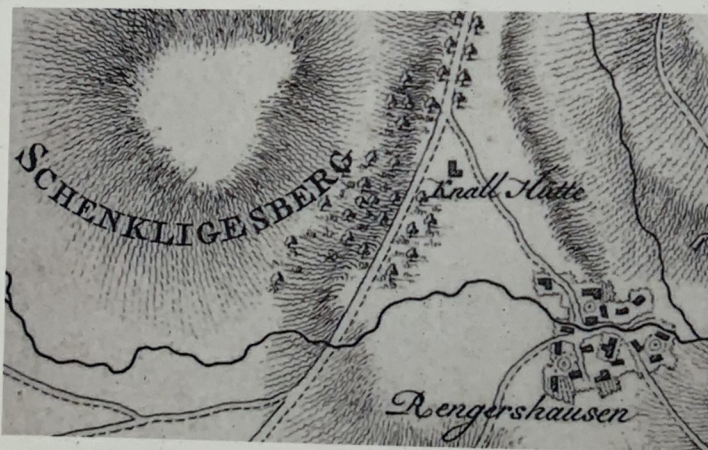
Plan zur alliierten Belagerung Kassels im Herbst 1762. Hier findet sich der Name „Knall Hütte“ vermutlich zum ersten Mal gedruckt.